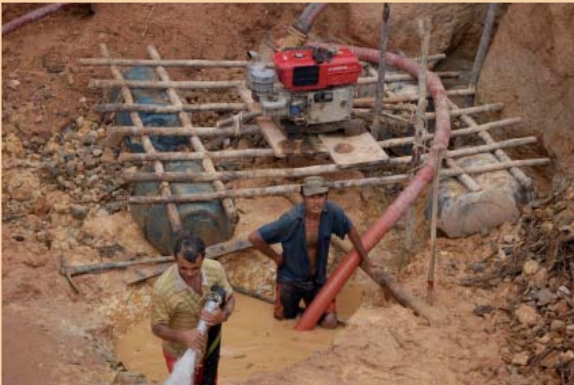
Garimpos ilegais fornecem matéria-prima para grandes empresas do sudeste

lentas. O material apreendido pelos órgãos ambientais é uma pequena parcela do mercado ilegal. No Pará, responsável por mais de 50% da produção nacional de madeira oriunda de extrativismo, o Ibama divulga ter apreendido 115,7 mil metros cúbicos de madeira serrada e em tora em 2008.