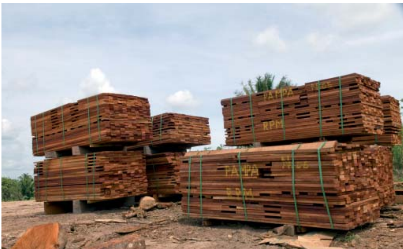
Pátio da Rio Pardo Madeiras, empresa fantasma que vende para a Pampa Exportações