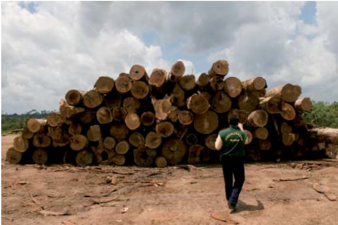
Gerente do Ibama de Altamira (PA) inspeciona madeira apreendida

gepa S.A., holding familiar de investimentos também controlada pela família Duval-Fleury, são geridos fundos de cerca de €200 milhões (R$ 563,7 milhões).