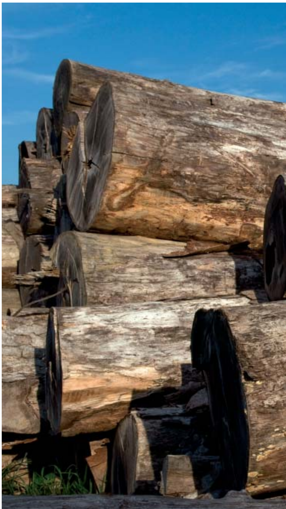
Madeira apreendida no pátio da Madeball. A empresa já foi lacrada pelo Ibama mas

A denúncia, que culminou no pedido, pelo Ministério Público do Pará, de cancelamento de 99 assentamentos criados no estado entre 2005 e 2006, incluía assentamentos-fantasma, renda da exploração da madeira às empresas e escolha, por parte das madeireiras, de áreas para criação dos assentamentos. Este último delito foi confirmado por depoimento de madeireiros à CPI (Comissão Parlamentar de Inquérito) da Biopirataria em 2006. Segundo a denúncia, as áreas dos as-