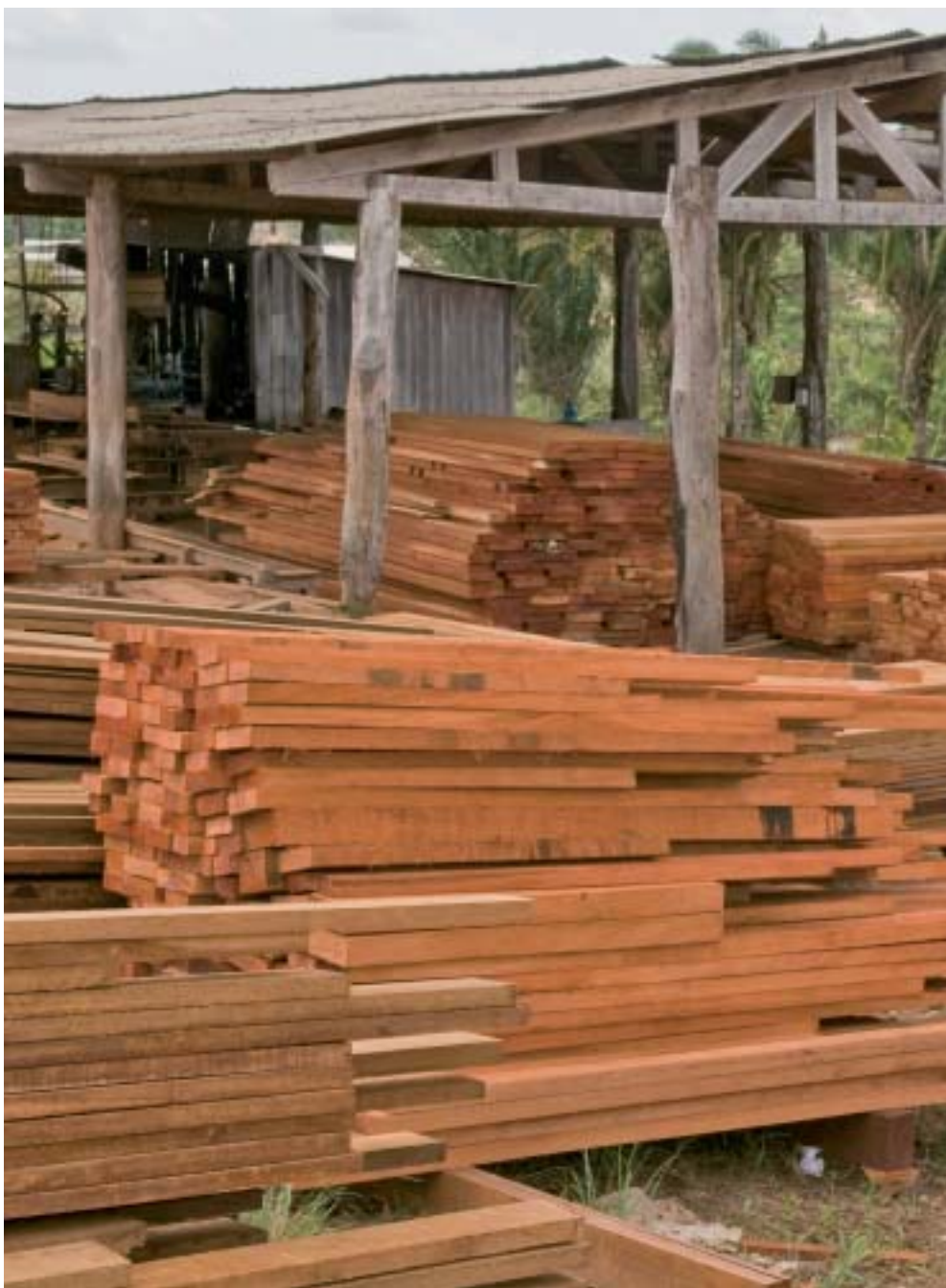
Pátio de empresa fantasma localizada em Anapu (PA) : 100% de madeira

O comércio predatório envolve desde lojas francesas do segmento 'faça você mesmo' até fornecedor de produtos para shows televisivos americanos sobre reformas residenciais.