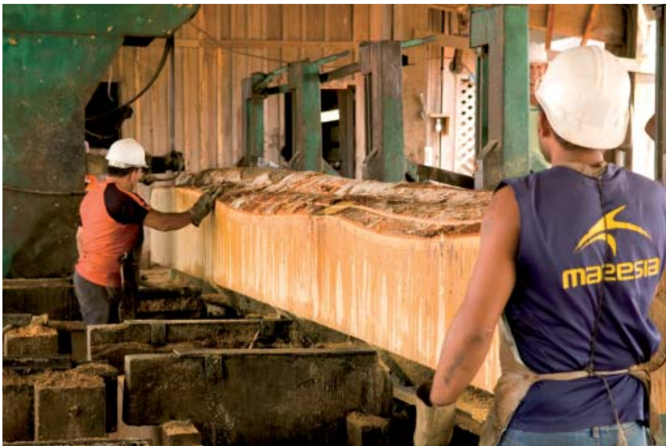
Madeira retirada ilegalmente é beneficiada no interior do Pará