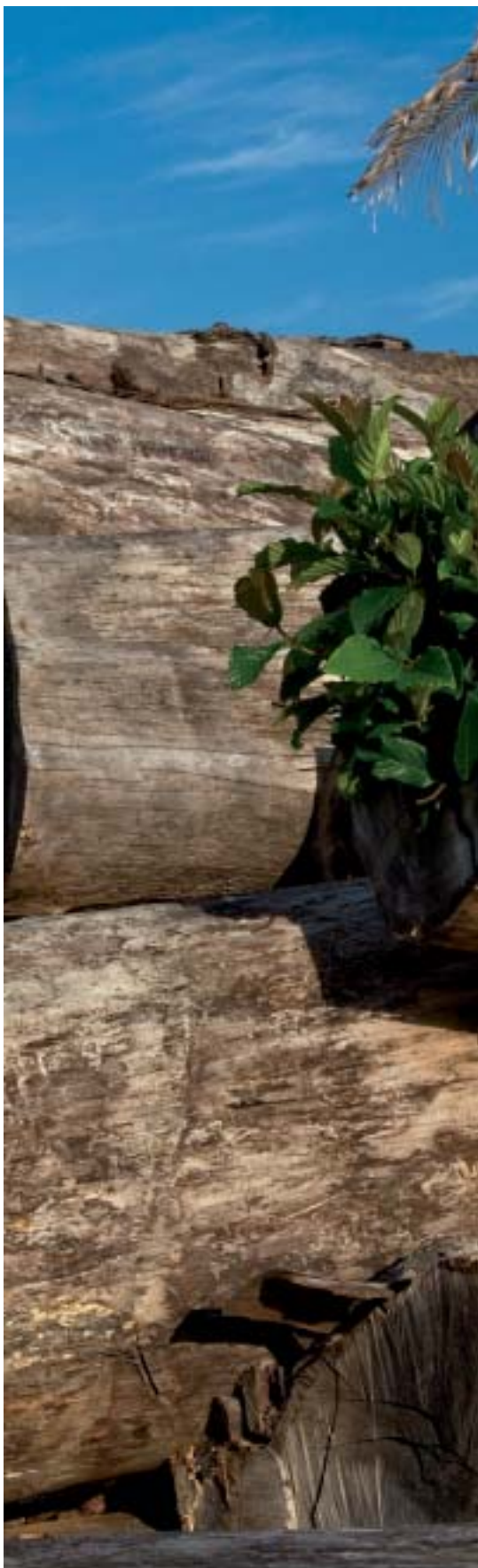
continua trabalhando com madeira ilegal.

sentamentos eram escolhidas de acordo com a disponibilidade de madeira de maior valor comercial.