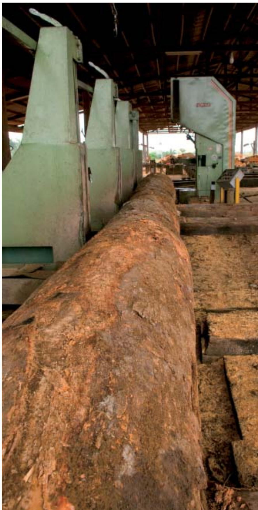
Madeira ilegal é preparada para o beneficiamento

ilegal sabendo disso”, diz. “O grande problema é que a gente nunca sabe, e acaba descobrindo só depois as falcatruas que o fornecedor faz”.