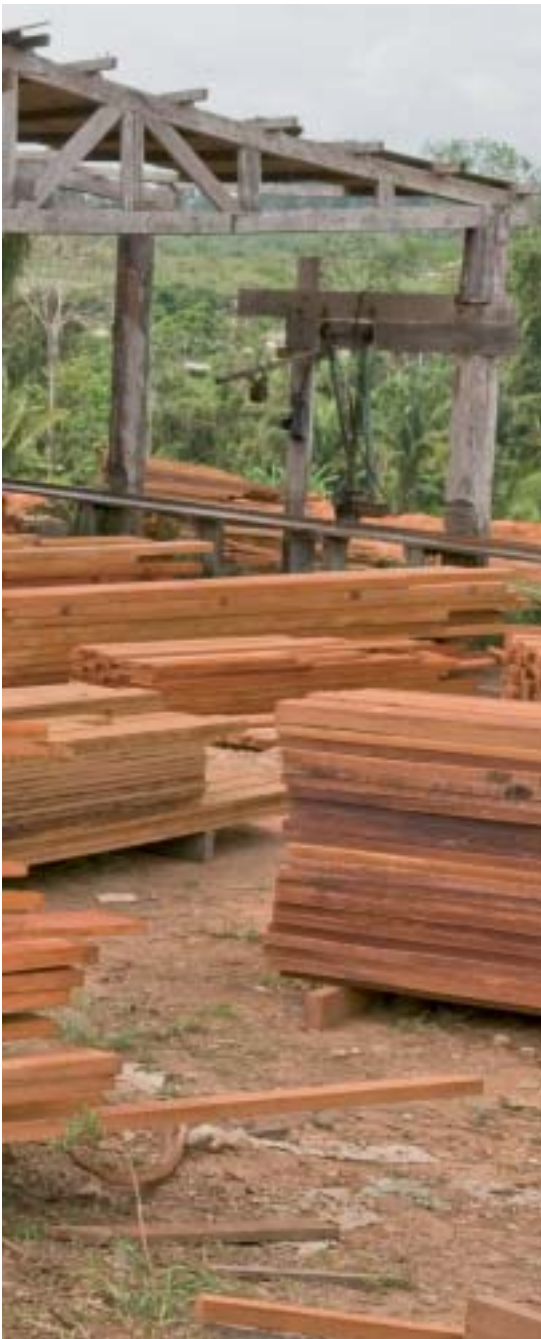
ilegal, toda ela para exportação

Em 2007, o Instituto Brasileiro do Meio Ambiente e dos Recursos Naturais Renováveis (Ibama) aplicou quase R$ 1 bilhão em multas contra o desmatamento ilegal na Amazônia. Em 2008, só no Pará foram aplicadas multas no valor de R$ 600 milhões. Não é novidade que a madeira oriunda da Amazônia é, em sua maior parte, obtida de forma ilegal. As multas são um exemplo disso, já que uma ínfima parcela de madeira ilegal é apreendida.